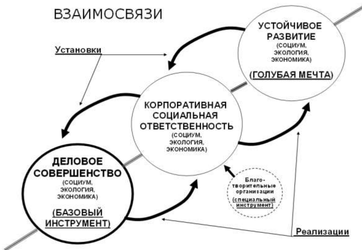
Рис. 2. Взаимосвязи между Устойчивым развитием, КСО и Деловым совершенством

Это та малая часть общей социально ориентированной деятельности организаций, которая отражает поверхностное видение, прежде всего, PR-служб. А основополагающей в формировании социально ответственных организаций и обеспечении устойчивого развития, является именно ежедневная основная профессиональная деятельность этих организаций, их деловое совершенство и непрерывное системное совершенствование (рис. 2).