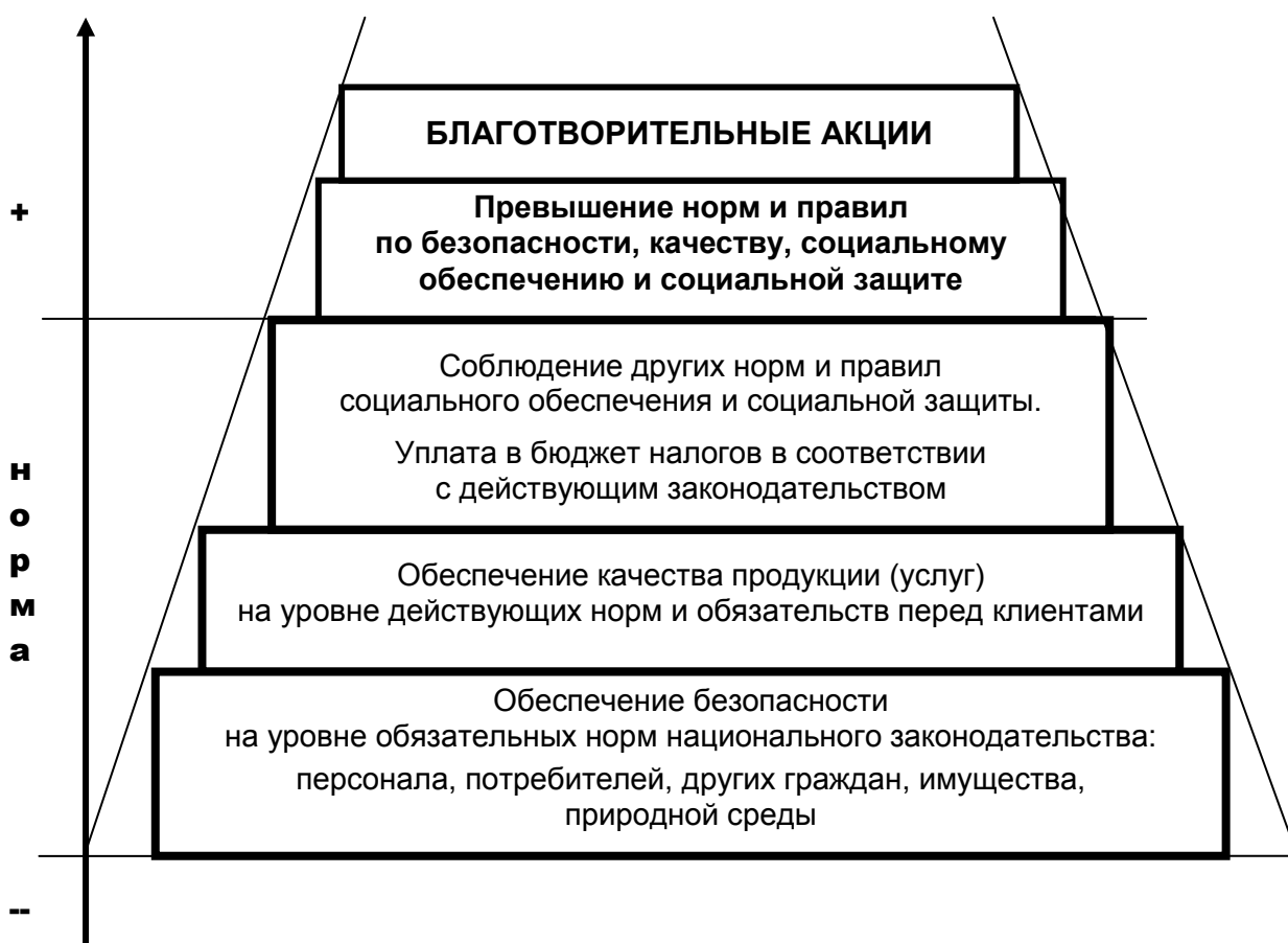
Рис. 1. Пирамида КСО

«Посмотрев в корень», можно увидеть, что благотворительность и аналогичная деятельность, выполняемая вне профессионального предназначения компании – это только «вершки» в формировании КСО и устойчивого развития (рис. 1).