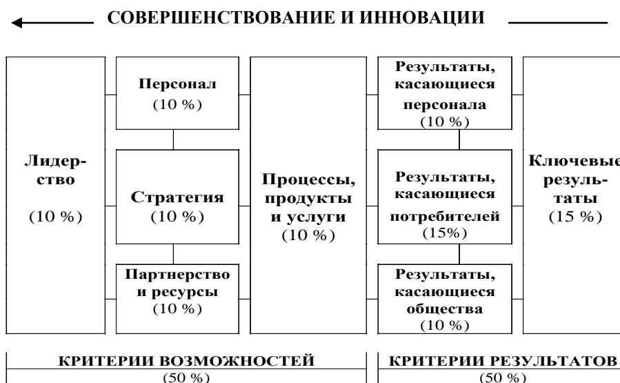
Рис. 3. Модель совершенства EFQM

Одной из самых популярных является европейская модель (Модель EFQM), которую в настоящее время применяют более 30 тыс. компаний во всем мире. Эта модель может быть использована для получения целостного представления о любой организации, независимо от формы собственности, размера, отрасли или уровня зрелости. Модель способствует руководству компании в формировании стратегии, привлечении к процессам совершенствования всего персонала, созданию уникальной культуры, где устойчивое превосходство является нормой. Модель EFQM, которая в наибольшей степени подходит для Украины, всесторонне описывает любую организацию через 9 критериев: Лидерство ; Стратегия ; Персонал ; Партнерство и ресурсы ; Процессы, продукты и услуги ; Результаты, касающиеся персонала ; Результаты, касающиеся потребителей ; Результаты, касающиеся общества ; Ключевые результаты , которые относятся к Потребителям , Персоналу и Обществу ; Ключевые результаты (рис. 3).